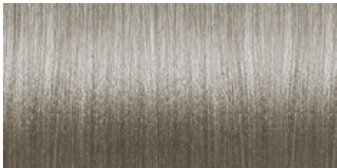
8BA MEDIUM BLOND BLUE ASH