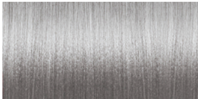
9BA LYS BLOND BLUE ASH